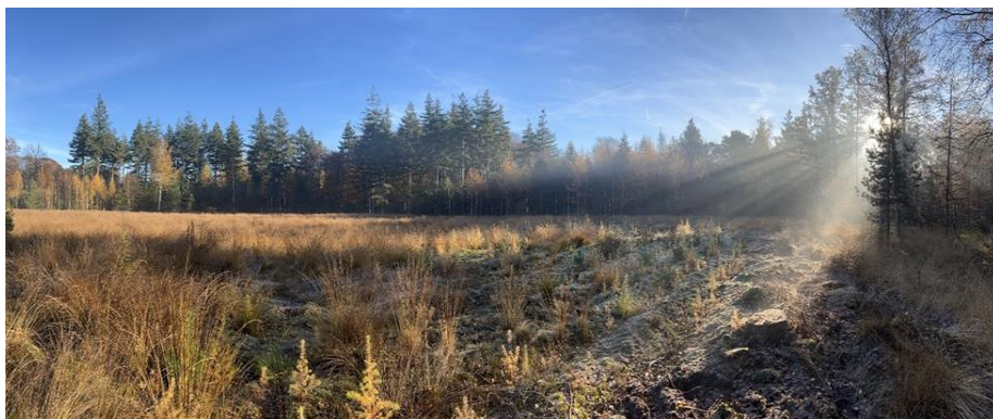
Landgoed Den Treek voor de nieuwe aanplant

Actuele informatie omtrent lopende en nieuwe projecten is te vinden op de website van de stichting: www.meerbomenplanten.nl .