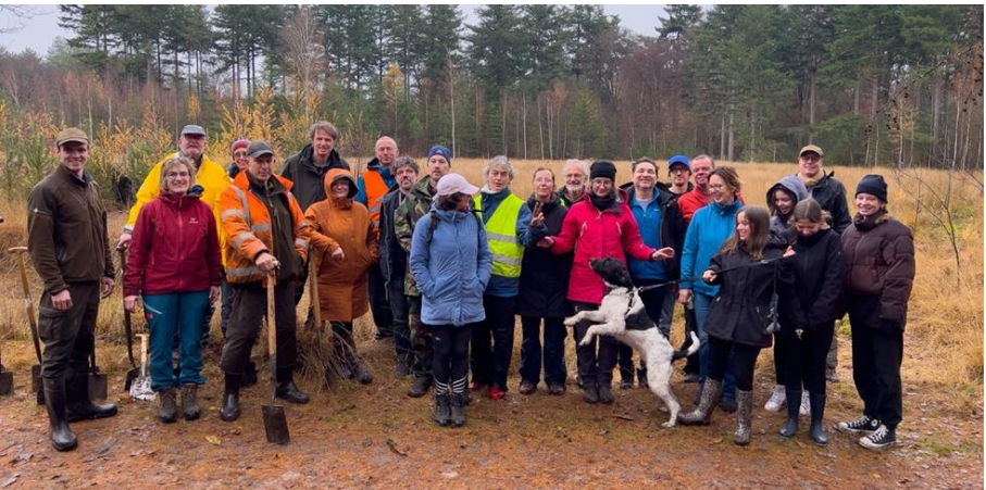
Vrijwilligers en medewerkers van Den Treek

Al met al, nog meer zen in deze boomplantdag dan in de vorige. De indruk is dat het project voor iedere betrokkene voldoening bracht.