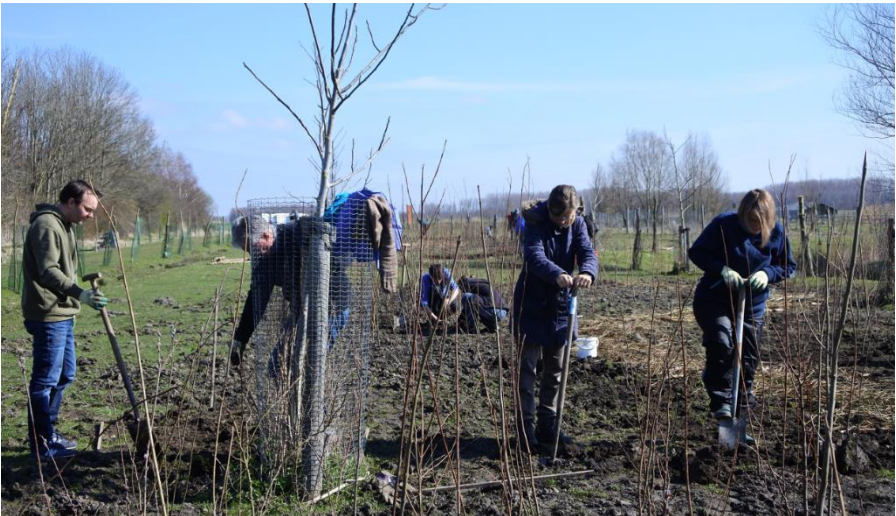
Aanplant van de tweede fase in maart 2022

Op 9 en 12 maart 2022 zijn in het Stiltegoed van Delft twee voedselbosjes aangeplant, goed voor zo'n 1000 bomen en struiken. Deze vormen een onderdeel van een reeks van vijf kleine bosclementen die in drie fasen worden aangelegd. De eerste fase van twee bosjes, samen 1600 bomen, is in het voorjaar 2021 aangeplant. De tweede fase in 2022 wordt gevormd door de voedselbossen en in het voorjaar van 2023 wordt de derde fase van circa 1000 bomen geplant. Het gaat in totaal dus om circa 3600 bomen en struiken.